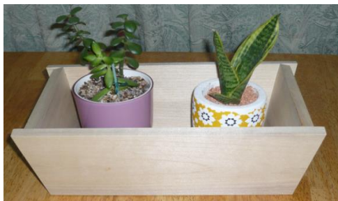
ウッド・プランター(木工技術科)