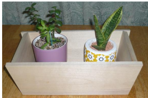
ウッド・プランター(木工技術科)