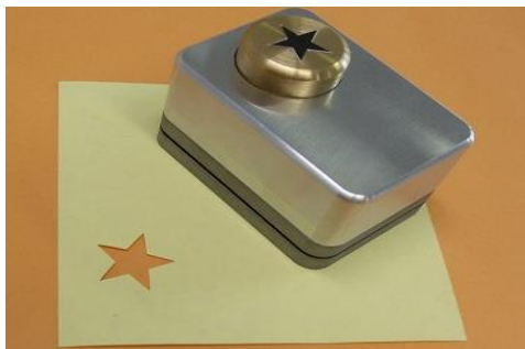
クラフトパンチ(金型加工科)