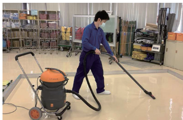
給水バキューム作業