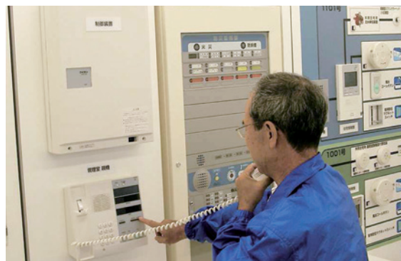
防災機器の操作実習