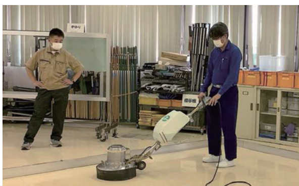
ポリッシャーの基本操作作業