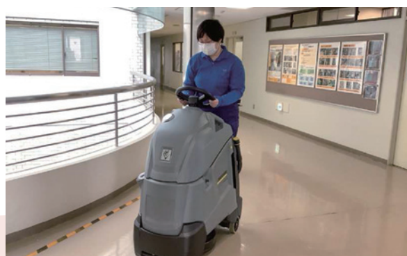
自動床洗浄機作業