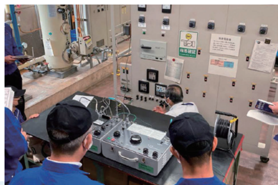
高圧受変電設備点検実習