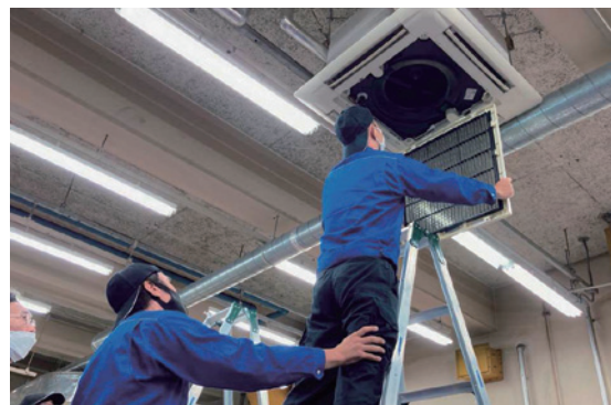
エアコン点検・清掃実習