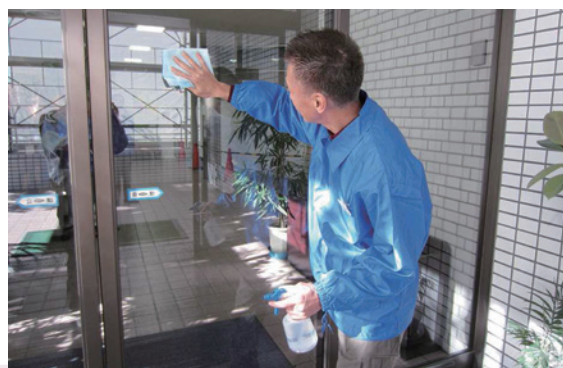
クリーニング手法（窓ガラス清掃）