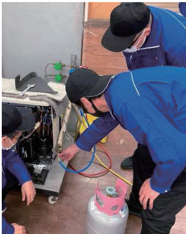
家庭用エアコン点検等実習