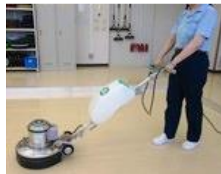
ビルクリーニング（ポリッシャー作業）

◆ 意欲ある生徒への求人お待ちしています！ 当科目は就職先である業界の雇用形態が多様で、パートやアルバイトでの求人も多くある職種です。このため、子育てや介護など生活と仕事の調和を希望する生徒の中には、訓練で技術を身に着けた上で 短時間勤務など多様な働き方での就職を目指す方もいます。