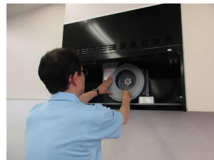
ハウスクリーニング（換気扇分解洗浄作業）