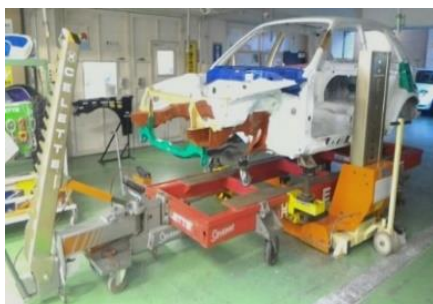
板金作業(フレーム修正)