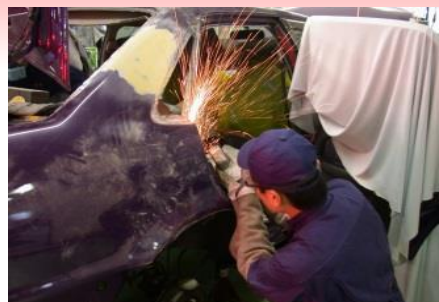
板金作業(パネル交換)