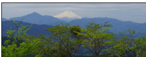
高尾山頂より富士山を望む