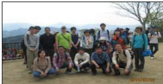
山頂にて記念撮影

普段、CAD製図科では、手描きやCADによる製図の訓練を実施しておりますが、高尾山登山はまさに心身の鍛錬といえます。山登りも普段の訓練とよく似ていて、一歩や二歩進んでも景色はたいして変わりませんが、この一歩一歩を積み重ねることによって、今まで見えなかったものが見えてくるようになります。さらに、その周辺のこと加加速的に理解できるようになります。また、段差の大きい一歩は登るのに苦労しますが、クラスメイトで分かち合えば苦労は軽減しますし、そうして体得したことはいざというときに真価を発揮します。山頂での眺めは素晴らしいものがありました。今後の訓練でも、就職という山頂を目指して、一歩一歩着実に前進してほしいと思います。