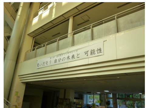
校内吹抜けに金賞の垂幕設置

『「多摩職業能力開発センター府中校」って何をしている機関なの?』と聞かれることがよくあります。そうした場合、「昔で言う職業訓練校です」と回答すると多くの方が理解をしてくれます。