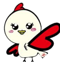
赤羽校公式キャラクター あかばねちゃん