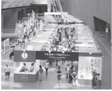
▲昨年度開催の様子【全国ブース】