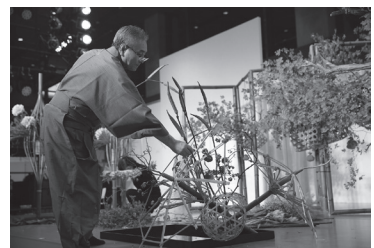
▲昨年度開催の様子【いけばな】