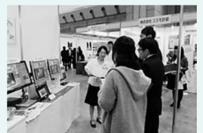
▲会社の説明を受ける参加者

ツアーと同時進行で、就活準備や会社の選び方などを講義する「就活ハッケン講座」が行われました。また、午後からは、東京しごとセンターが「Oneday就活カレッジ」を開催。求人票の見方等の講義(就活研究)と面接等に活かせるフェイスエクササイズ(就活体感)の2種類の講座(計6講座)を行い、参加者は熱心に聴講、実践していました。