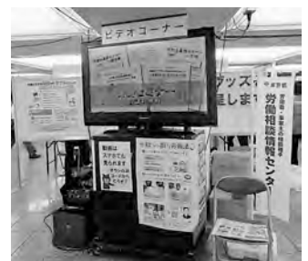
▲若者向けの動画「知らないと損する労働法」の紹介を行いました。

労働相談情報センター、労働委員会事務局等の職員のほか、労働基準監督署、公共職業安定所(ハローワーク)等の相談員の協力を得て、労働問題全般についての相談に応じました。このほか、資料コーナーでは「ポケット労働法」など、都が発行した資料を配布、またパネルコーナーでは「労働者派遣法改正について」「仕事と介護の両立」などの説明パネルを展示しました。また、若者向けにアルバイト先でのトラブル事例をわかりやすく解説した動画「知らないで損する労働法」の紹介も行いました。期間中の来場者は約7,300人、相談は約162件ありました。「労働契約」「有給休暇」「労働保険・社会保険」に関する相談が多く寄せられました。