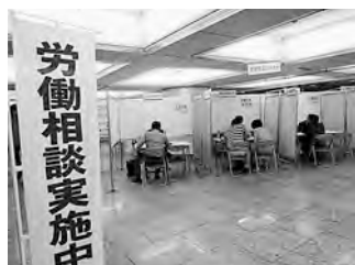
▲相談コーナーでは、多岐にわたる相談が寄せられました。

東京都では、毎年5月と10月を「労働相談強調月間」と定め、駅前などに臨時の相談会場を設け、街頭労働相談を実施しています。今年も5月17日から31日にかけて、新宿、池袋、上野御徒町、町田、浜松町、立川の6か所で行われました。