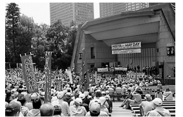
▲各団体の決意表明・訴えが行われた日比谷メーデー