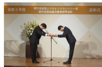
【令和5年度 表彰式の様子】