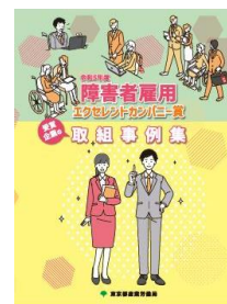
【令和5年度 取組事例集】