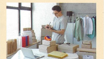
物流・サービスコース