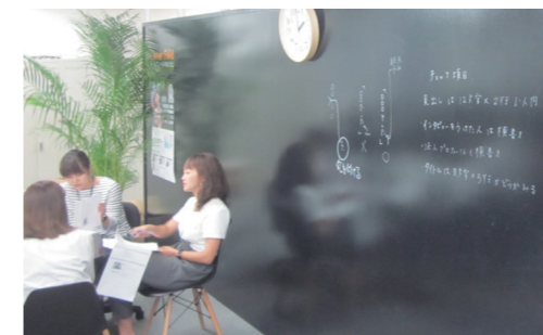
新しいアイデアを創造するコミュニケーションボード