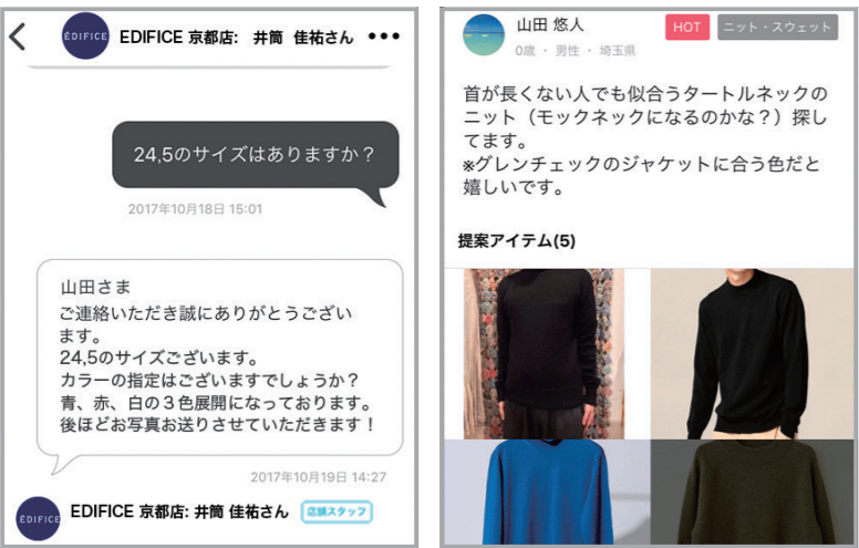
ファッションアプリ「FACY」の利用イメージ画面