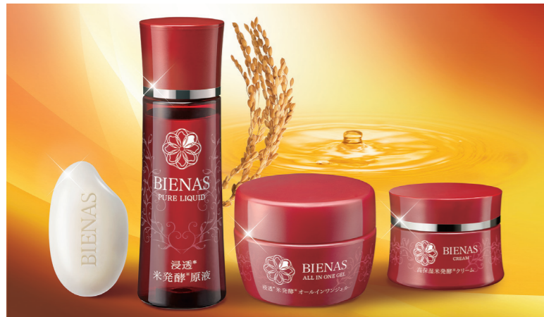
厳選した素材を使用した化粧品「ビエナス」