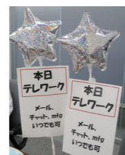
在宅勤務中であることをわかりやすく周知

実際にテレワークをやってみると対象者の周囲では「誰が在宅勤務なのか、休みなのか不明瞭」という意見が挙がりました。席にいないため休みだと思われて連絡が翌日にされてしまったり、お客様への対応がすぐにできなかつたりしたことは問題でした。急ぎの対応策として、アナログですが誰にでも分かるように風船の目印を作成しました。これを在宅勤務者のデスクに設置すると、思った以上の効果を発揮しました。在宅勤務